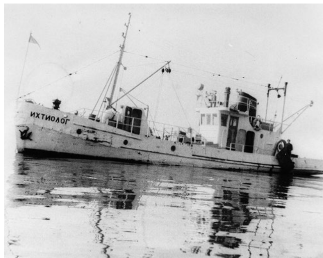
Научно-исследовательское судно «Ихтиолог» за работой в Белом озере, конец 1970-х – начало 1980-х гг.

В дальнейшем проводились регулярные исследования сырьевых ресурсов рыбопромысловых водоё-